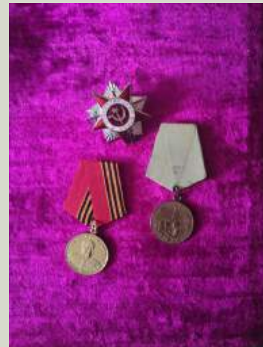
Медали моей прабабушки