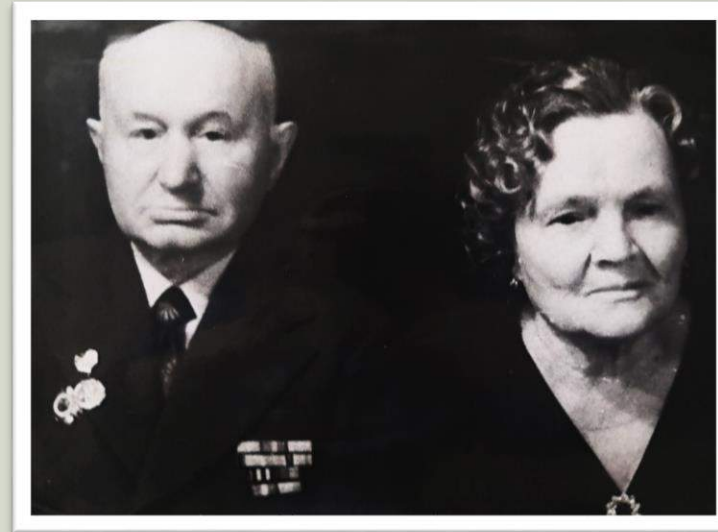
Мои прадедушка и прабабушка вместе(1986 год)